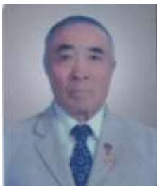
Монгол улсын гавьяат багш Л.Жамц

Сурган хүмүүжүүлэх шинжлэх ухааны доктор, Монгол улсын тэргүүлэх зэргийн профессор, гавьяат багш. ЕБС-ийн физик, математикийн болон багш бэлтгэдэг их, дээд сургуулийн “Сурган хүмүүжүүлэх зүй”, “Сэтгэл судлал”, “Боловсрол судлал”-ын 40 гаруй сурах бичиг, гарын авлага, 100 гаруй эрдэм шинжилгээний өгүүлэл зэрэг 510 гаруй бүтээлтэй.